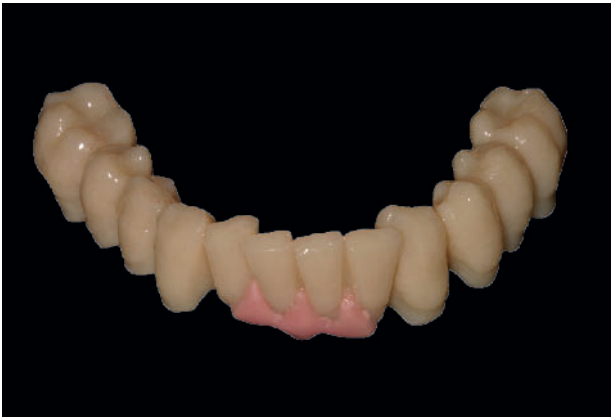
Abbildung 2 Implantat-prothetische Planungsphase: Das aufgewachste Mok-up simuliert das anvisierte Therapieziel.