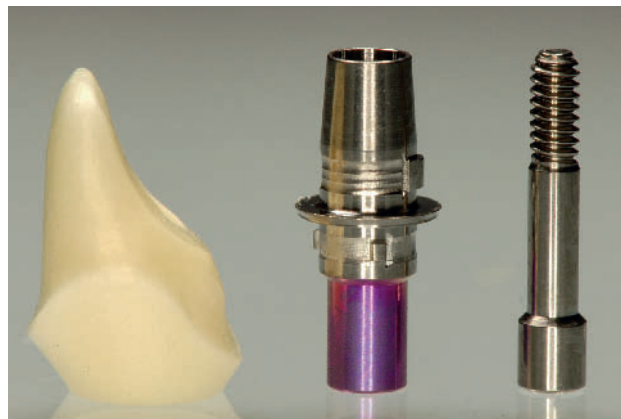
Abbildung 5 Die Titanhülse stabilisiert das ZrO_2 -Abutment und vermeidet Zugspannung bei Verschraubung.