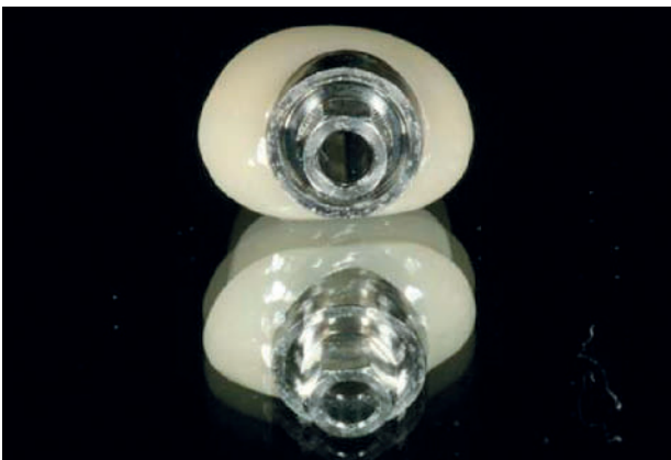
Abbildung 4 Individueller ZrO_2 -Aufbau, verklebt auf dem stabilisierenden Titan-Abutment (Hybrid-Abutment).