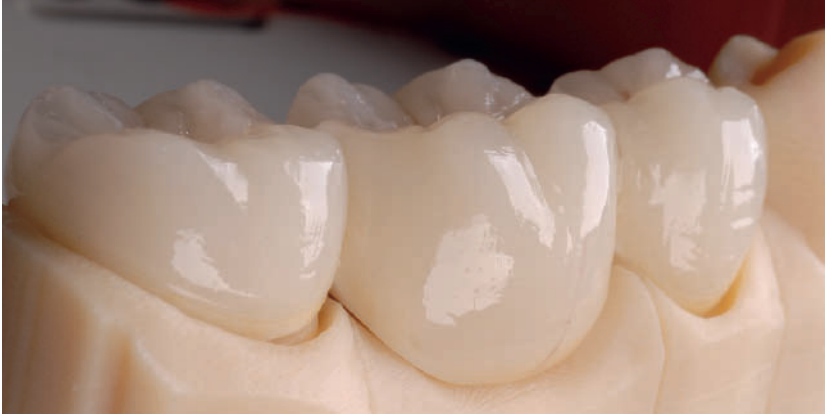
Abbildung 10 Endgültige Brücke mit aufgesinterter CAD/CAM-Verblendung.

umgangen. Die Haltbarkeit der Klebung am Interface von Titanimplantat und Mesiostruktur erhielt eine gute Prognose [5]. Zur Konditionierung der Titan- und ZrO_2 -Klebeflächen empfiehlt sich eine Strahlung mit 50 \mu m -Korn Al_2O_3 , 1 bar Strahldruck aus 20 mm Entfernung, gefolgt von einem Silanauftrag (Zirconia Primer) und der definitiven Verklebung mit Monomorphosphat.