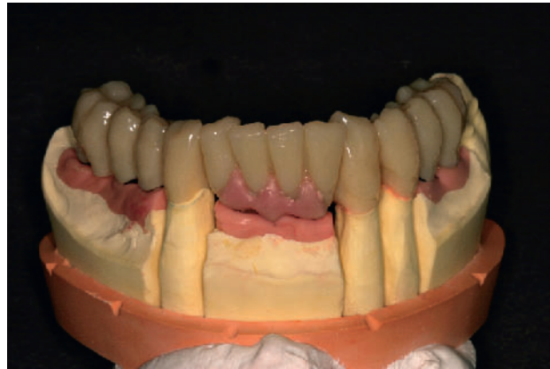
Abbildung 3 Auf dem Modell wird die Gestaltung des periimplantären Weichgewebes sichtbar.