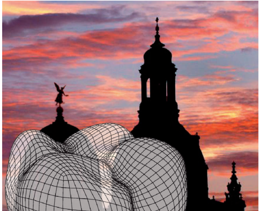
Abbildung 1 11 Jahre klinische Erfahrung bot das 11. Keramik-Symposium der AG Keramik in Frankfurt.

Laut Dr. Marquardt kommt neben der Schaffung von idealen klinischen Ausgangsbedingungen der harmonischen Integration des Zahnersatzes, insbesondere bei fehlenden Einzelzähnen im Oberkiefer-Frontzahnbereich, eine hohe Bedeutung zu. Für den langfristigen klinischen Erfolg einer Implantation ist neben der Osseointegration