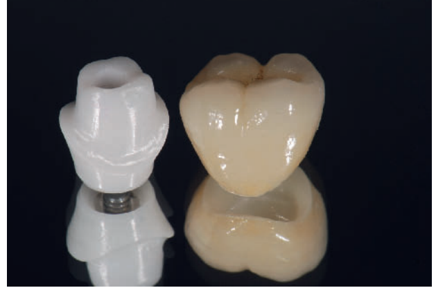
Abbildung 7 Das ZrO_2 -Abutment maskiert die Metallstruktur und unterstützt die Lichttransmission in der Krone ( LS_2 ).