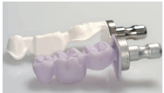
Abbildung 9 Ausgefrästes Brückengerüst aus ZrO_2 (hinten) und Verblendschale aus LS_2 vor dem farbbestimmenden Kristallisationsbrand.

Weichgewebe (Abb. 2, 3), Gingivaformer für das Durchtrittsprofil, prothetische Aufbauteile und die Zahnform gestalterisch festgelegt. Für die Herstellung individueller Abutments und Mesostrukturen sowie der definitiven Krone oder Brücke aus ZrO_2 oder Lithiumdisilikat ( LS_2 ) haben sich die CAD/CAM-Verfahren bewährt [2]. Neue lichtoptische Scannersysteme ermöglichen die digitale Intraoralabformung mit hoher Genauigkeit und unterstützen automatisierte Prozesse, die nicht nur einen Vorschlag für das spätere Abutment-Design, sondern mit Hilfe von Querschnittsbildern auch Vorlagen zur Gestaltung der idealen Morphologie und für das transgingivale Emergenzprofil liefern.