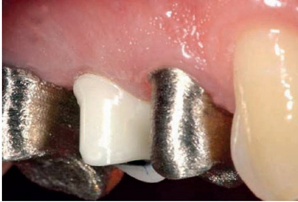
Abbildung 6 ZrO_2 -Abutment in situ. Im Vergleich Goldkappchen auf natürlichen Zähnen. Die zahnähnliche Opazität und Form von ZrO_2 vereinfacht das ästhetische Konzept. (Abb. 6: Marquardt/Semsch)